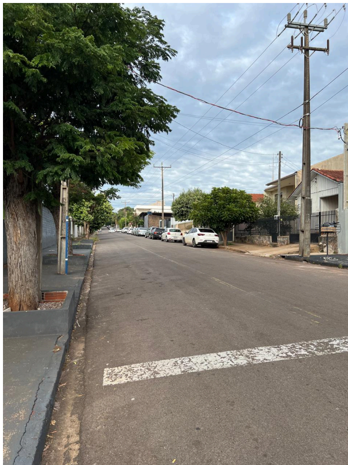
Visão da Rua Juventino Baraldi sentido Nicola Stefano

Rua Bernardino Bogo, 175 – Vila Bernadino Bogo – Caixa Postal 81 – CEP 87160-000