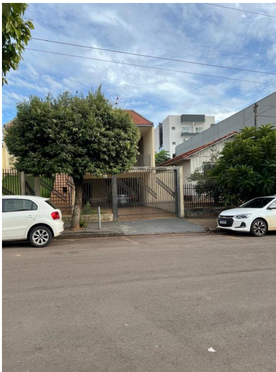
Acesso de Guia Rebaixada (3)