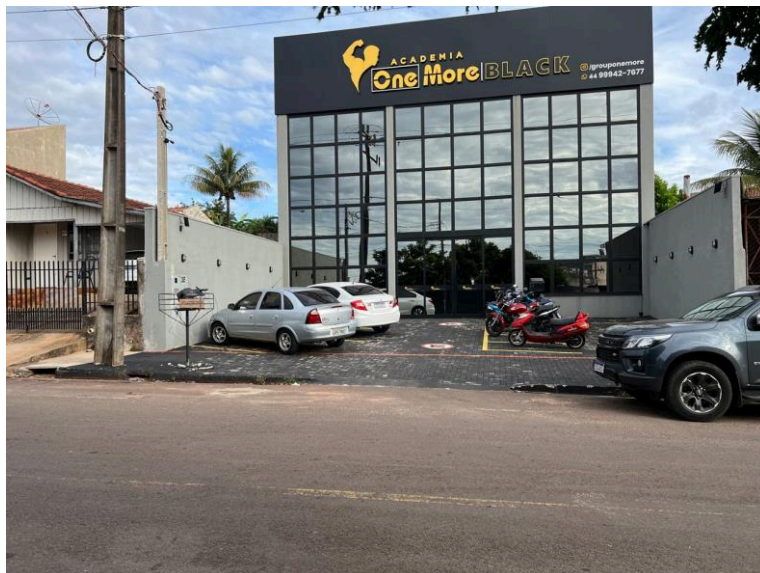
Visão do recuo da Academia One More Black