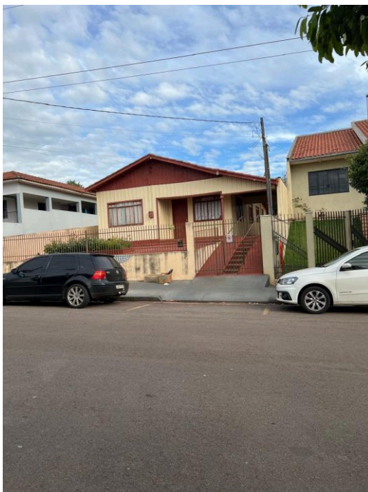
Acesso de Guia Rebaixada (2)

Rua Bernardino Bogo, 175 – Vila Bernadino Bogo – Caixa Postal 81 – CEP 87160-000