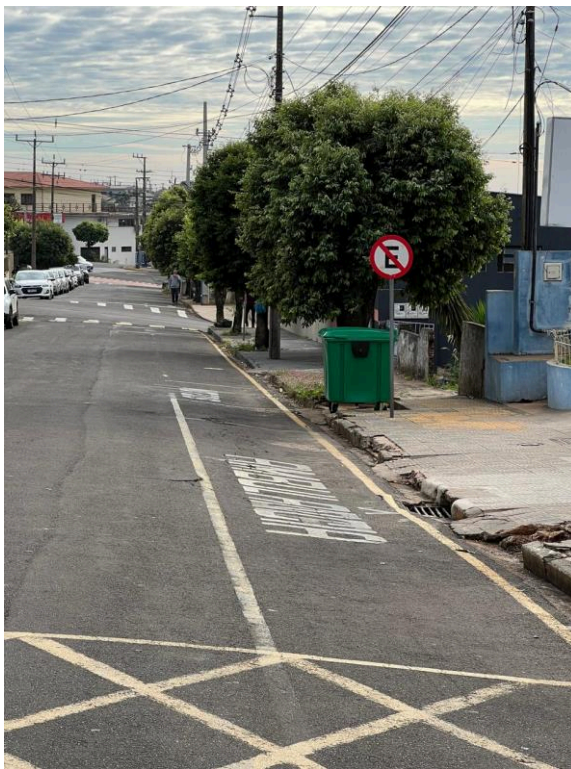
Visão Rua Juventino Baraldi (frente UBS) sentido Munhoz da Rocha – acima da Rua Nicola Stefano

Rua Bernardino Bogo, 175 – Vila Bernadino Bogo – Caixa Postal 81 – CEP 87160-000