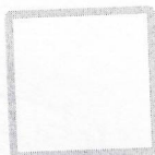
ALEXANDRE CURTI Presidente da Assembleia Legislativa do Estado do Paraná

A handwritten signature in black ink, appearing to read "Alex. Curi".